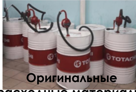
Оригинальные расходные материалы.