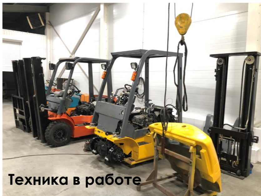
Техника в работе