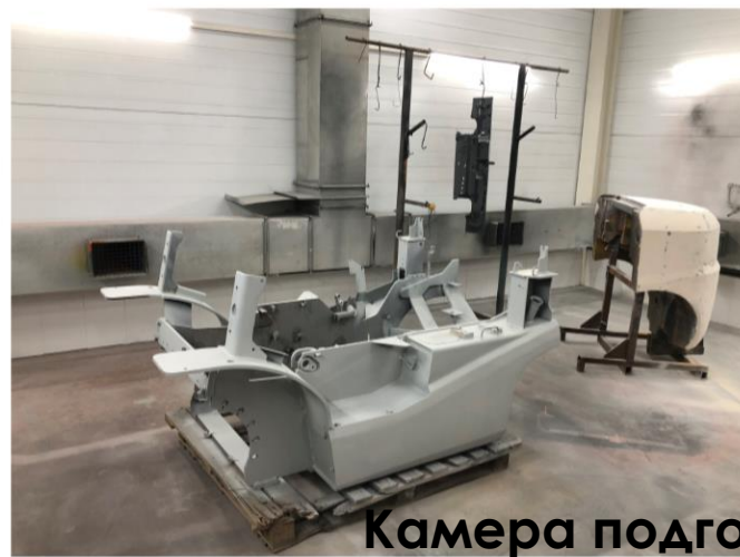
Камера подготовки и окраски деталей.