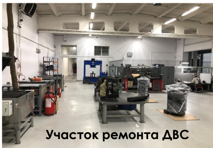
Участок ремонта ДВС