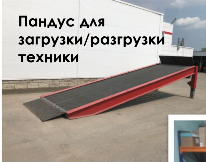
Пандус для загрузки/разгрузки техники