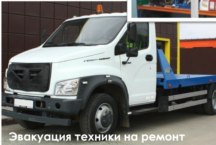
Эвакуация техники на ремонт